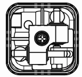
VISTA PARZIALE A (partial view A)